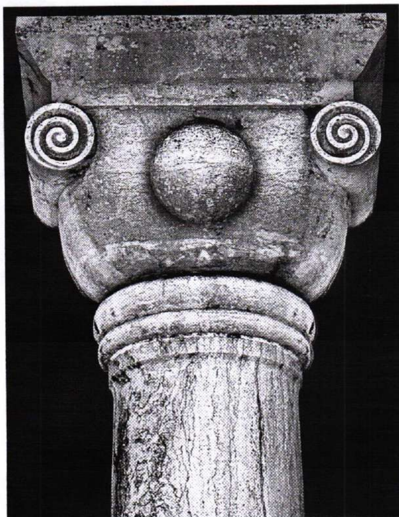
© Μελέτη για ένα Escape Citizen (GRECIA), Ανδρέας Αγγελιδάκης, 2026

Ως πράξη ουσιαστική, η μόνη που μπορεί ακόμα να ανοίξει ρωγμές εκεί που όλα φαίνονται λεία και ρυθμισμένα. Η σύγκρουση που αξίζει δεν είναι αυτοαναφορική, δεν είναι εκπλήρωση μίας υποχρέωσης στο πλαίσιο ενός αναμενόμενου ρεπερτορίου διαμαρτυρίας. Είναι η σύγκρουση που βλέπει κάτι συγκεκριμένο, αληθινό, επείγον και αρνείται να συμφιλιωθεί μαζί του αβασάνιστα. Που επισημαίνει, που ανατρέπει, που αφυπνίζει. Η ελληνική συμμετοχή στην 61η Διεθνή Έκθεση Τέχνης – La Biennale di Venezia κινείται με αυτό το πνεύμα. Έρχεται να θέσει ερωτήματα, με τόλμη, με ακρίβεια, με τέχνη που έχει κάτι να πει και ξέρει γιατί το λέει».